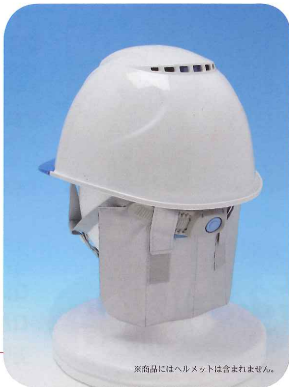
※商品にはヘルメットは含まれません。