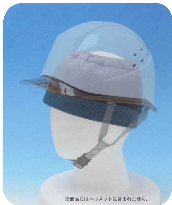
※商品にはヘルメットは含まれません。