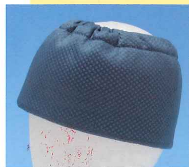
頭部周辺を覆うように特殊収水体の面積も広くなりました。

サイズはフリーサイズで、どなたにもピッタリとフィットします。汗取り用として通年使用もできます。